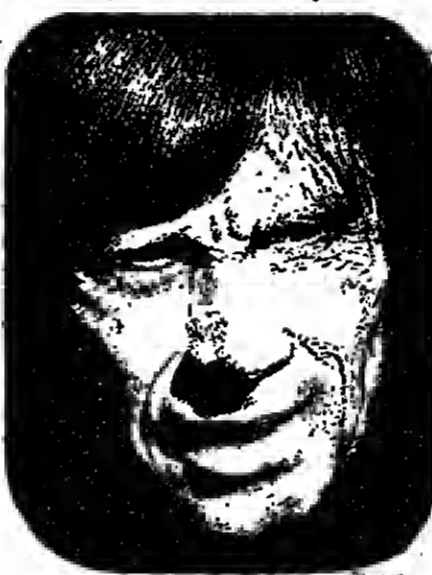
* Dessin de HÉLÈNE OLEVA.